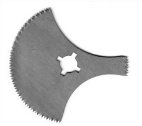
30.212.09 Sägeblatt zweiseitig