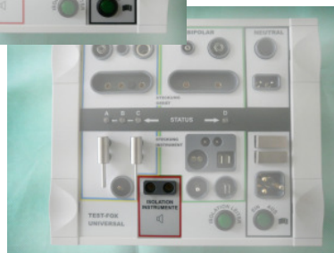
Prüfbereich für Isolationen