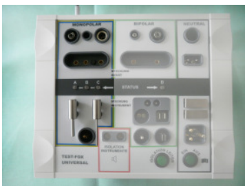
Prüfbereich für monopolare Kabel und Griffe